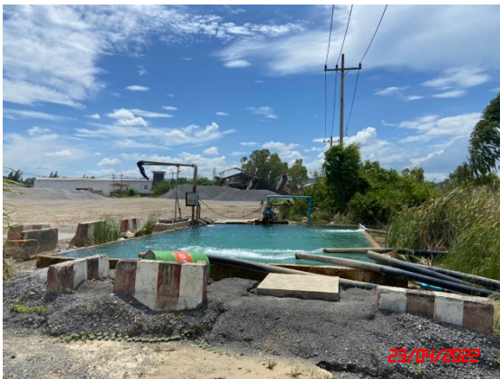
บ่อดักตะกอนบริเวณ บ3