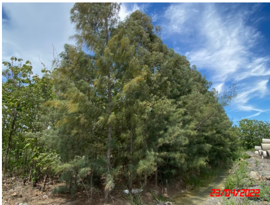
รูปที่ 2-18 แนวต้นไม้รอบพื้นที่โครงการ