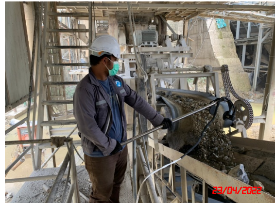
จุดถ่ายโอนสายพาน