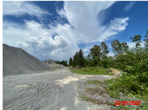
รูปที่ 2-2 ลักษณะหน้าเหมืองปัจจุบันของโครงการ