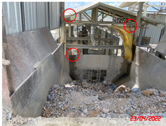
ระบบสเปรย์น้ำบริเวณยังรับหินใหญ่