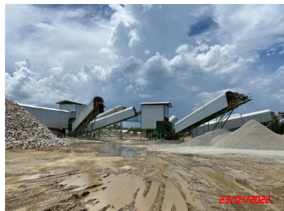
อาคารปิดคลุมโรงโม่หิน