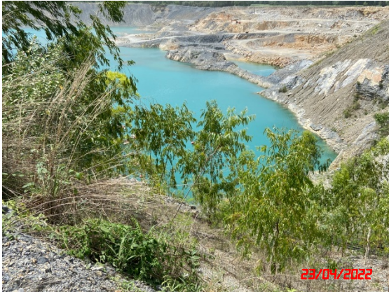
บ่อดักตะกอนบริเวณ บ1