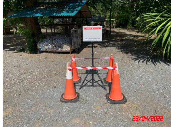
บ้านลู่ตะแบก