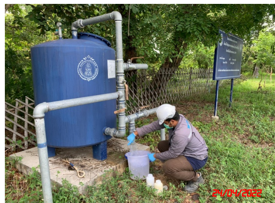
น้ำบาดาลบ้านสุเต่า