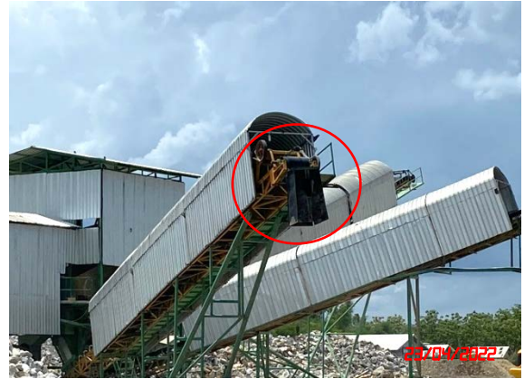
อุปกรณ์ปลายสายพานลำเลียง