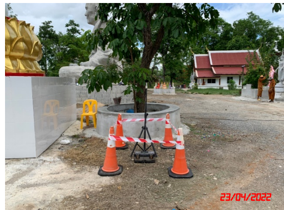
บ้านผาแดง