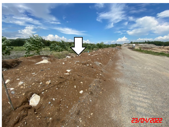
คันทำนบดิน