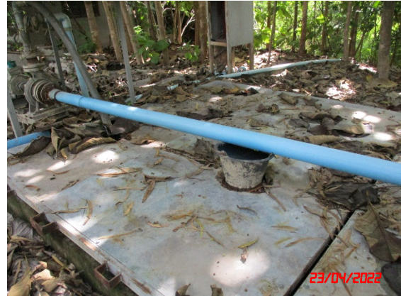
บ่อดักตะกอนบริเวณ บ2