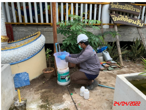
น้ำบ่อต้นบ้านผาแดง