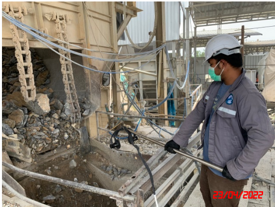
ปากโมหินใหญ่