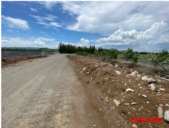
รูปที่ 2-1 พื้นที่เว้นไม่ทำเหมือง