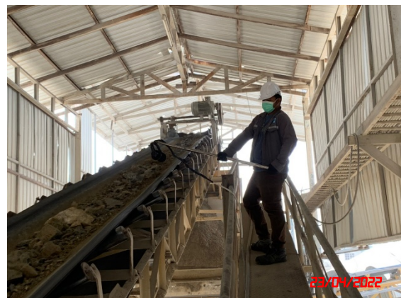
ปลายสายพานลำเลียง