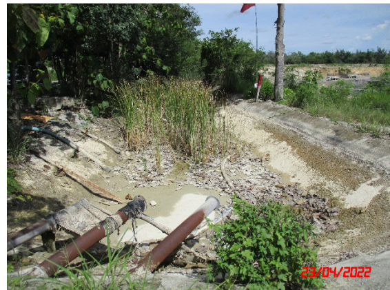
บ่อดักตะกอนบริเวณ บ4