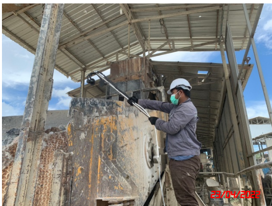
ตะแกรงคัดขนาด