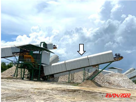
หลังคาปิดคลุมสายพานลำเลียง