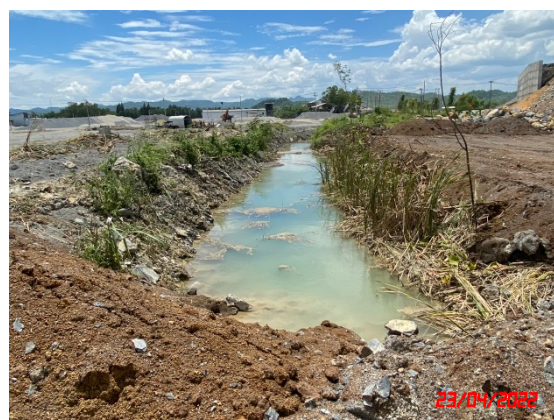
คูระบายน้ำ