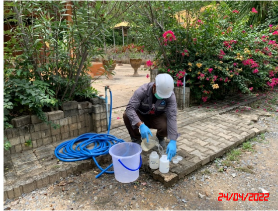
น้ำบาดาลบ้านลูตะแบก