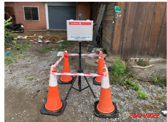
บ้านลูเต่า