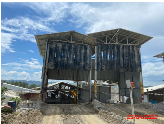
อาคารปิดคลุมยังรับหินใหญ่