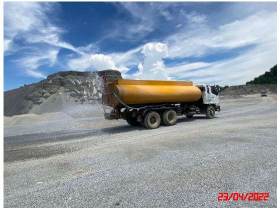
รูปที่ 2-10 สภาพเส้นทางขนส่งแร่